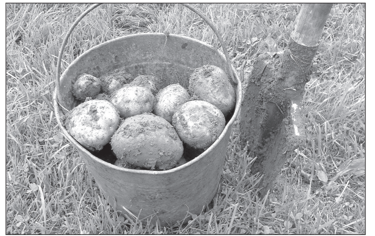
Если выкопанная картошка облеплена влажной землёй, сразу очищать её нельзя - повредится кожица, и клубни загниют.

Закладка картофеля на хранение - очень ответственный этап, от которого зависит успех всех трудов выращенного его огородника. Картофельные клубни довольно требовательны к условиям внешней среды - только их соблюдение даст возможность сохранить урожай без потери вкусовых качеств и максимально долгое время.