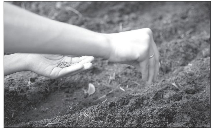
Осенью зелень лучше сеять поверхностно - «присаливанием».

Осенью грядки в огороде пустеют. Практически собран урожай овощей - одна лишь зимняя капуста сиротливо круглится да тыквы ловят оранжевыми боками остывающие лучи солнца. Обычно огородники сеют под зиму чеснок, лук и сидераты. Но практика показывает, что осенью можно посадить и другие культуры, успев собрать урожай до наступления холодов.