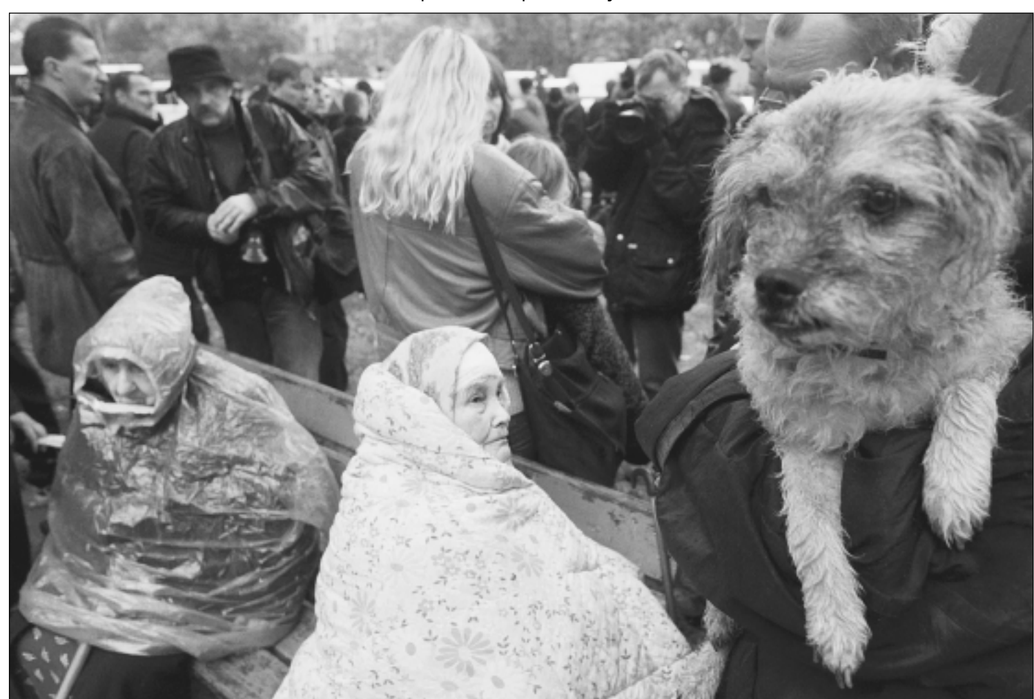
Утро после взрыва. Понедельник, 13 сентября с. г. Москва, Южный округ, Каширское шоссе