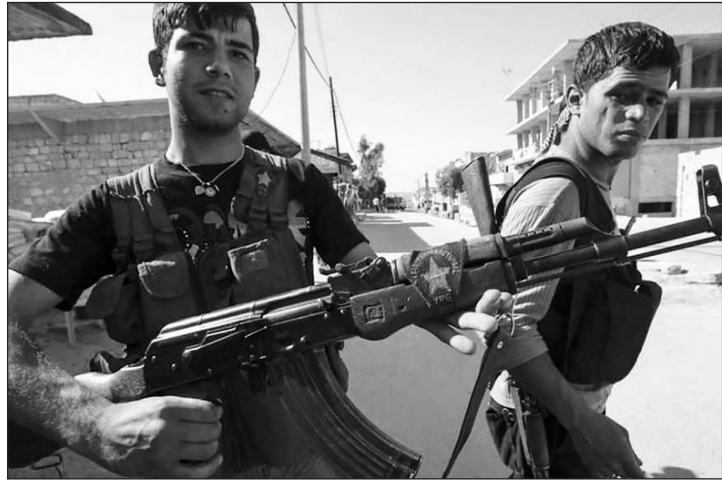
Террористическая организация могла быть создана турецкими спецслужбами.

Если РПК последовательно борется всеми доступными методами за права и свободы курдов, не исключая при этом перемирий с Анкарой, и даже в период военной фазы конфликтов старается избегать жертв среди мирных граждан, то ТАК не ограничивается на-