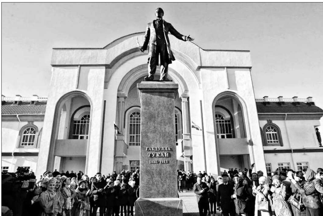
Памятник великому поэту — новый символ дружбы башкирского и татарского народов.

Руководители двух республик возложили цветы к подножию памятника, после чего посетили Уфимский государственный татарский театр «Нур» и ознакомились с проектом благоустройства прилегающей территории.