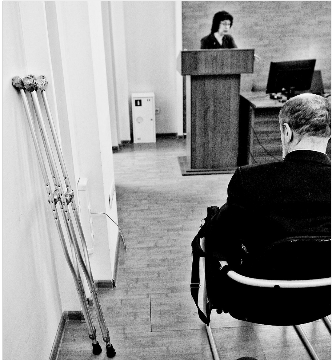
В День открытых дверей всем рассказали о тонкостях работы МСЭ.

Еще один пример из соцсетей: человек перенес операцию на мозге, а инвалидности не получил, хотя нарушены двигательные функции, обоняние, а в голове установлена металлическая пластина.