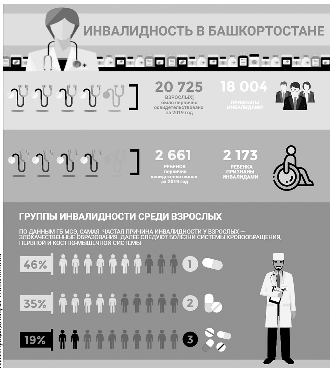
Иллюстрация: Дамира ФАИЗУЛЛИНА.

Но больше всего жалоб на то, что освидетельствование про-