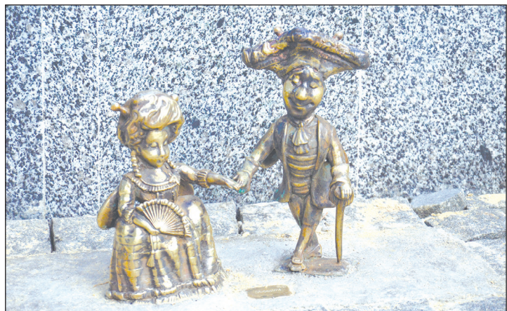
«Жители» Екатерининского сада - пчёлки императрица Екатерина II и князь Григорий Александрович Потёмкин-Таврический.