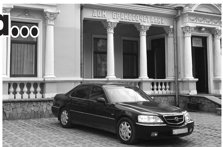
Браки заключаются на небесах, а регистрируются на земле.

Как пояснили в ведомстве, приём ведётся в режиме обычного рабочего времени по предварительной записи, исключение составляют первичные регистрации смерти и рождения. А вот проведение государственных регистраций браков по вторникам и средам временно не производится. Кроме того, по-прежнему сохраняются ограничения, связанные с количеством присутствующих на бракосочетании, - не более 10 человек, включая двух сотрудников ЗАГСа. То есть, получается, взять с собой на регистрацию молодожёны (уже два человека), могут только двух свидетелей и четырёх гостей. Пока вот так. Но зато провести церемонию