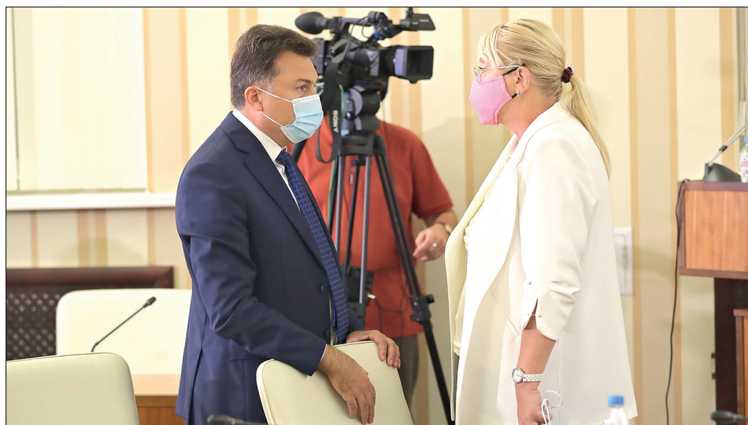
По словам вице-преьера Ирины Кивико, крымским чиновникам пора учиться экономить бюджетные средства.

У слабого исполнения бюджета есть, конечно, и объективные причины. В частности - нехватка рабочих рук на объектах ремонта и строительства. По оценкам специалистов, на сегодняшний день Крыму не хватает около 10 тысяч рабочих. Прежде всего в сфере строительства. Об этом заявил председатель крымского парламента Владимир Константинов. В то же время, напомнил, в республике продолжает расти уровень безработицы. По данным ГКУ РК «Центр занятости населения», если нормальный уровень зарегистрированной безработицы для Крыма составляет 0,4-0,5%, то сейчас этот показатель достиг 5,2%. Только в августе число безработных в регионе выросло на 13,3%.