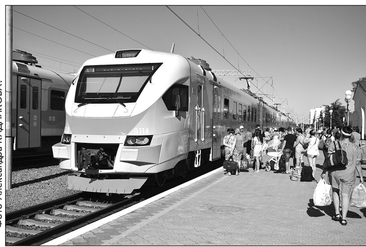
На железнодорожных перронах снова кипит жизнь - почти как в прежние времена.

Почему возле железной дороги больше не слышно грохота поездов?