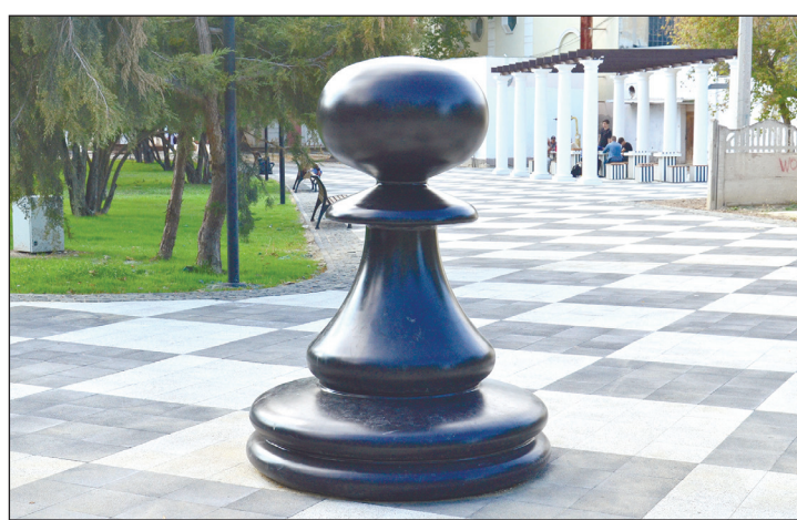
Скульптура «Пешка» высотой в человеческий рост выполнена из архитектурного полированного бетона чёрного цвета.