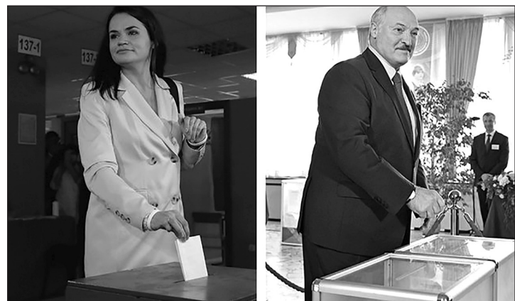
Свой выбор сделали 9 августа Светлана Тихановская и Александр Лукашенко.

Из капли фальши вырастает огромное грозное облако домыслов, говорил Никита МИХАЛКОВ в новом выпуске своей авторской программы на «БесогонТВ» «Антология фальши». «И тут важно понимать не только то, ЧТО говорят, но и ЗАЧЕМ, - продолжил он. - Это касается всех и всего. Это касается не только конкретных людей, программы, но и мировой политики, стран. Посмотрите на Республику Беларусь - ярчайший пример этого».