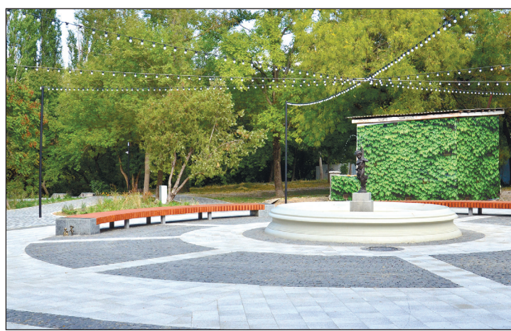
Круглая площадь у восстановленного фонтана «Мальчик с рыбкой», скамьями, необычной гирляндой освещения.