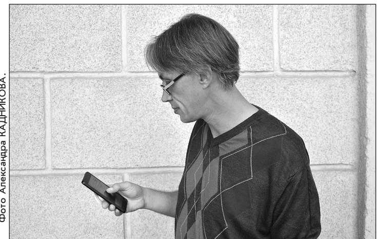
Если sim-карта оформлена не на вас, вы можете лишиться номера в любой момент без возможности восстановления.

Когда украинские операторы связи ушли из Крыма, жители полуострова фактически остались без связи. Ситуацию спасли sim-карты крупного российского мобильного оператора. Их раскупили за считанные дни, при этом не зарегистрировав их должным образом. В результате тысячи крымчан до сих пор пользуются так называемыми «серыми» или «анонимными» sim-картами. При этом они даже не подозревают, как сильно рискуют.