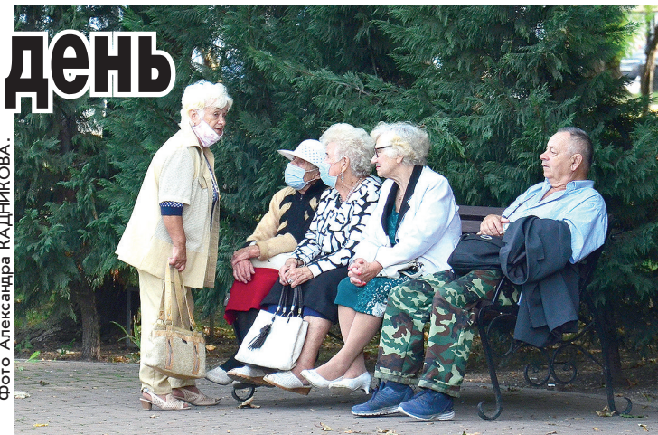
Режим самоизоляции на сей раз введут только для пожилых граждан - старше 65 лет.

«Конечно, мы можем закрыть границы Российской Федерации, мы идём к этому,