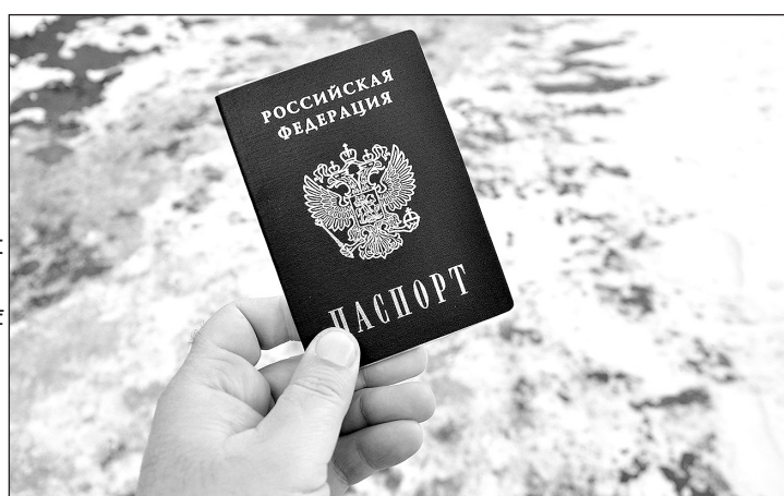
За утрату паспорта вам придётся заплатить 300 рублей штрафа, ещё 1500 рублей - за изготовление нового документа.