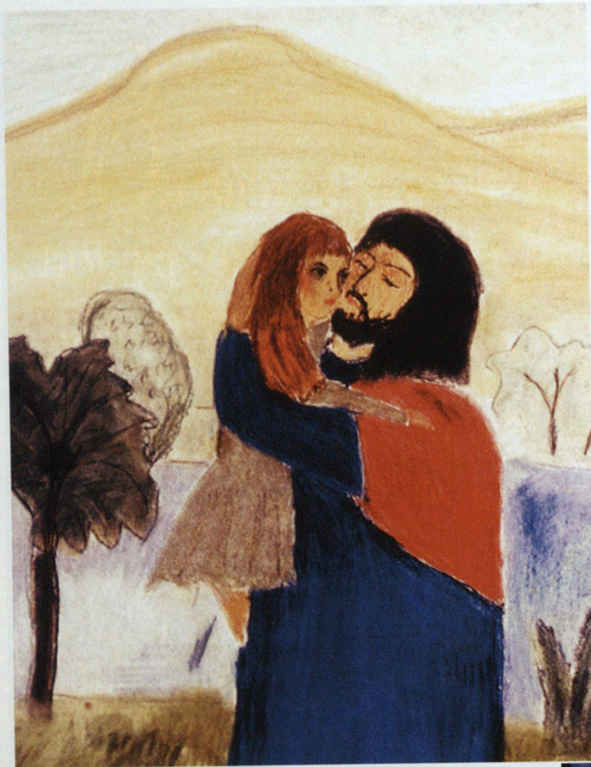
«И обняв их, возложил руки на них и благословил их». Рисунок Ксении Курепиной, сделанный в больнице