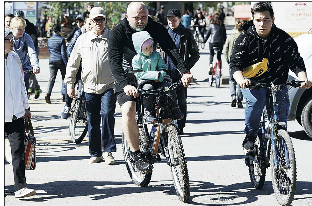
Для безопасности всех участников движения нужно создавать велоинфраструктуру.

Также считаю, что нужно снижать максимальную скорость