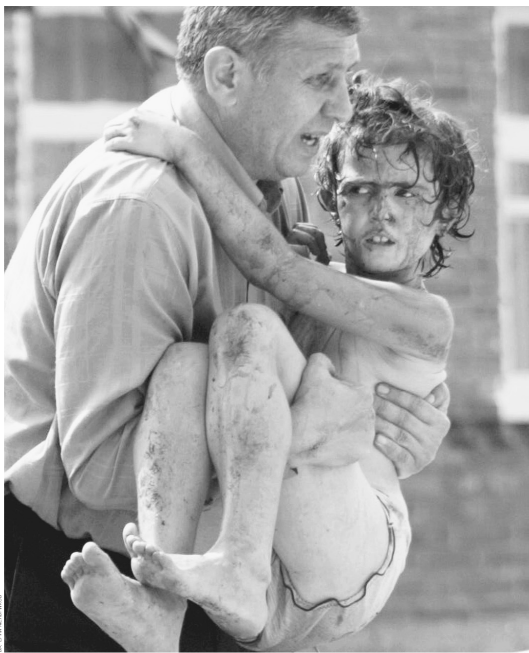
Среди жителей Беслана, нуждающихся в помощи, очень много мужчин, ставших отцами-одиночками

Я стою посреди пустой комнаты в доме, где погибла мать и четверо детей. Мать и все ее дети. У этой женщины не было мужа, и дом, где траур, — это дом ее брата. Пустой большой дом, в разных комнатах которого, как бы перекликаясь друг с другом,